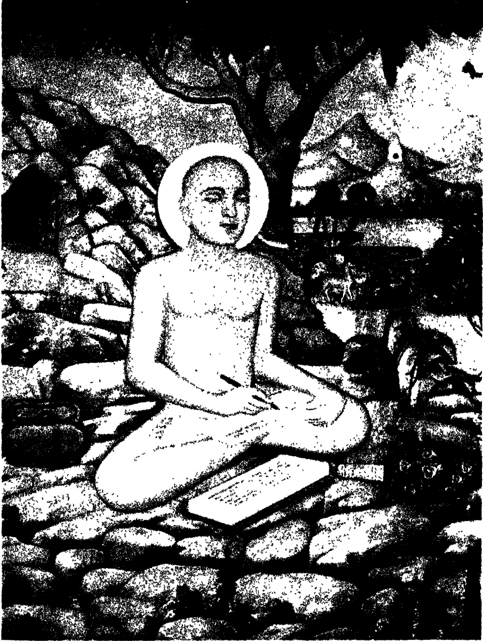
आचार्यवर श्री अमृतचन्द्रदेव